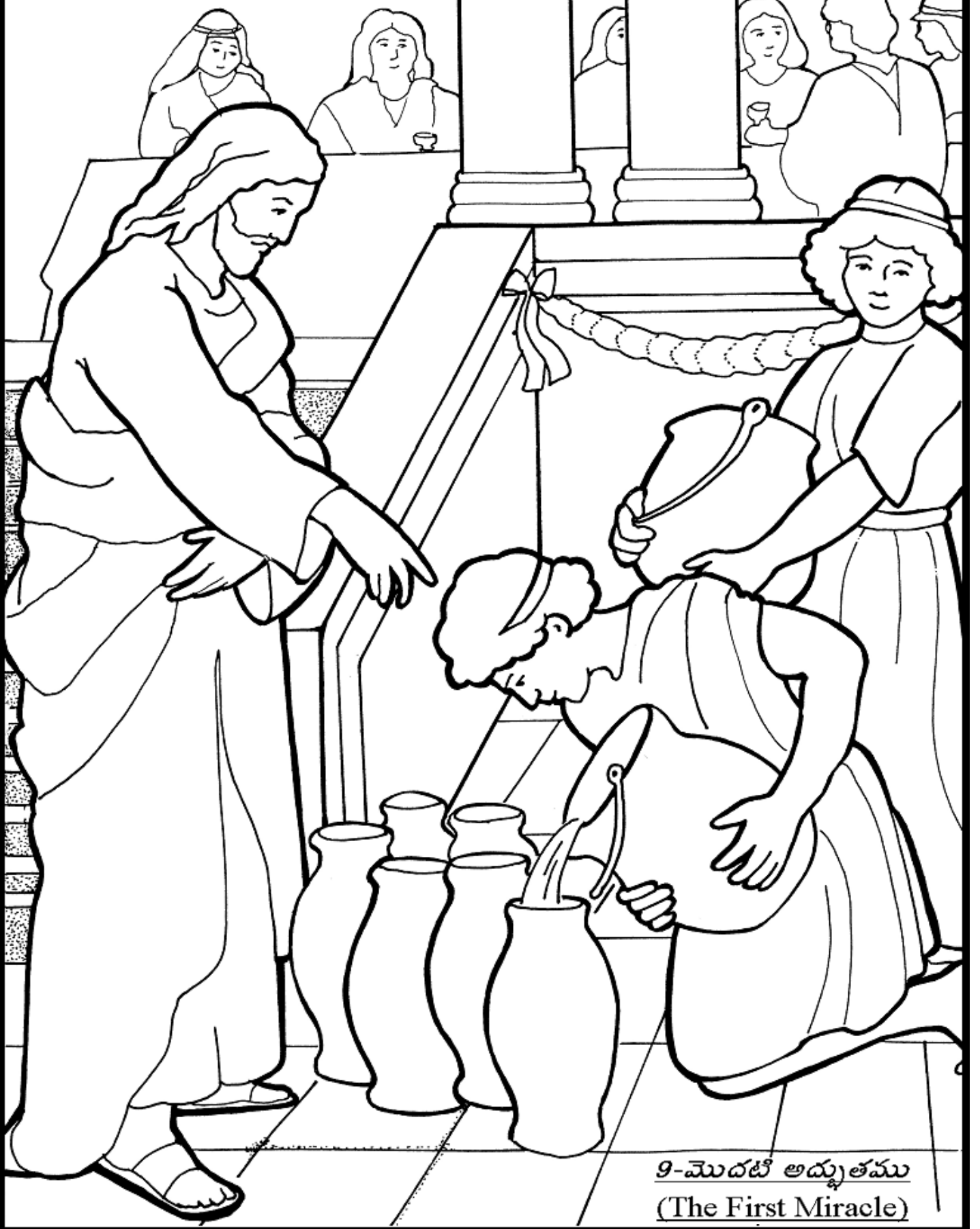
9-మొదటి అద్భుతము (The First Miracle)